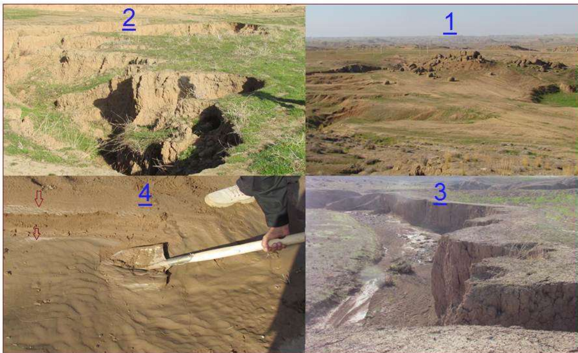
شکل ۴. دورنمای سازند آغاچاری و برونزدگی لایه ماسه‌سنگی آن با واریزه‌های گرد درشت (۱)، فرسایش خندقی فعال در مرتع ضعیف (۲) و پایاب اراضی کشاورزی (۳) و رسوبات تازه حاوی سیلت و گچ که با رنگ سفید در نوک فلش مشخص است (۴)