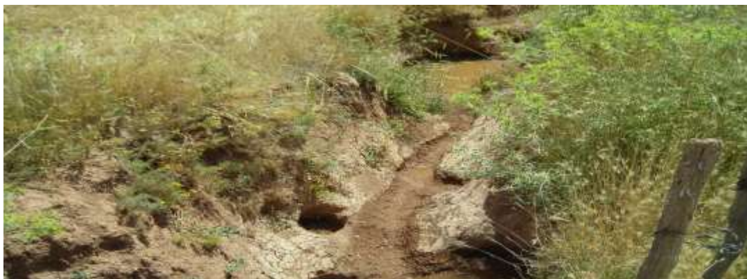
شکل ۵. نقش آبیاری غلط در تشدید پدیده انحلال در پایاب مزارع آبی (پادگانه رودخانه‌ای حاصل از نهشته‌های سازند کشکان در استان کرمانشاه) (۱۴۰۰)