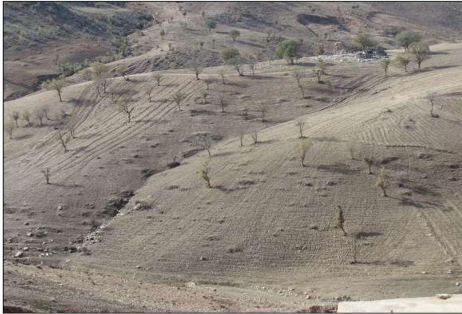
شکل ۳. تغییر کاربری شدید سازند مارنی (کشکان) در جنگل‌های جنوب شرقی شهرستان کرمانشاه (۱۳۹۹)